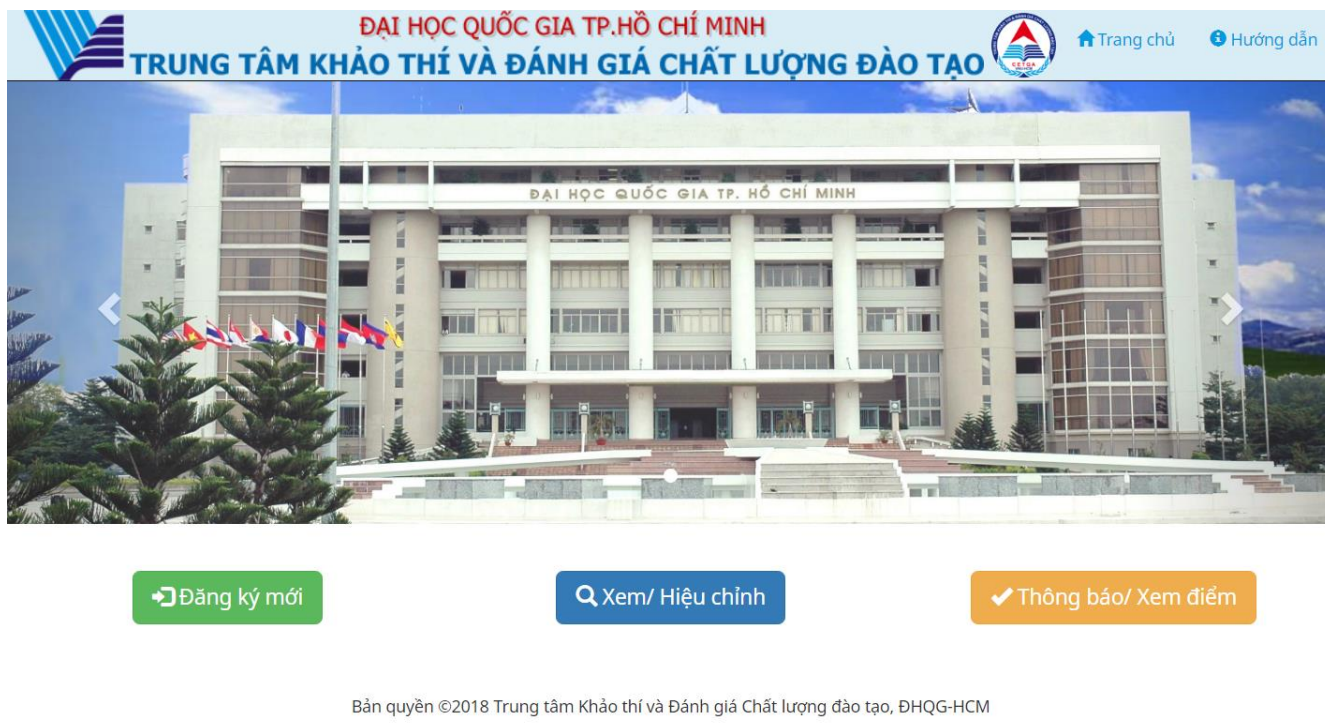
Hình 1. Trang chủ

Bước 1: Chọn nút “Xem/ Hiệu chỉnh” từ trang chủ (xem hình 1).