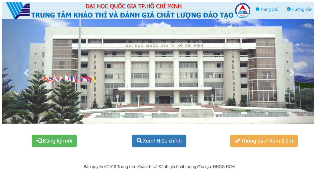
Hình 4. Trang chủ

Bước 1: Chọn nút “Thông báo/ Xem điểm” từ trang chủ (xem hình 4).